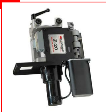
Z-20 bandningshuvud för låsning